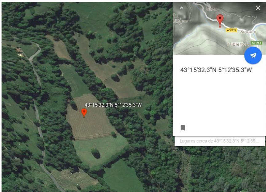
Imagen 2: El terreno de campamento.