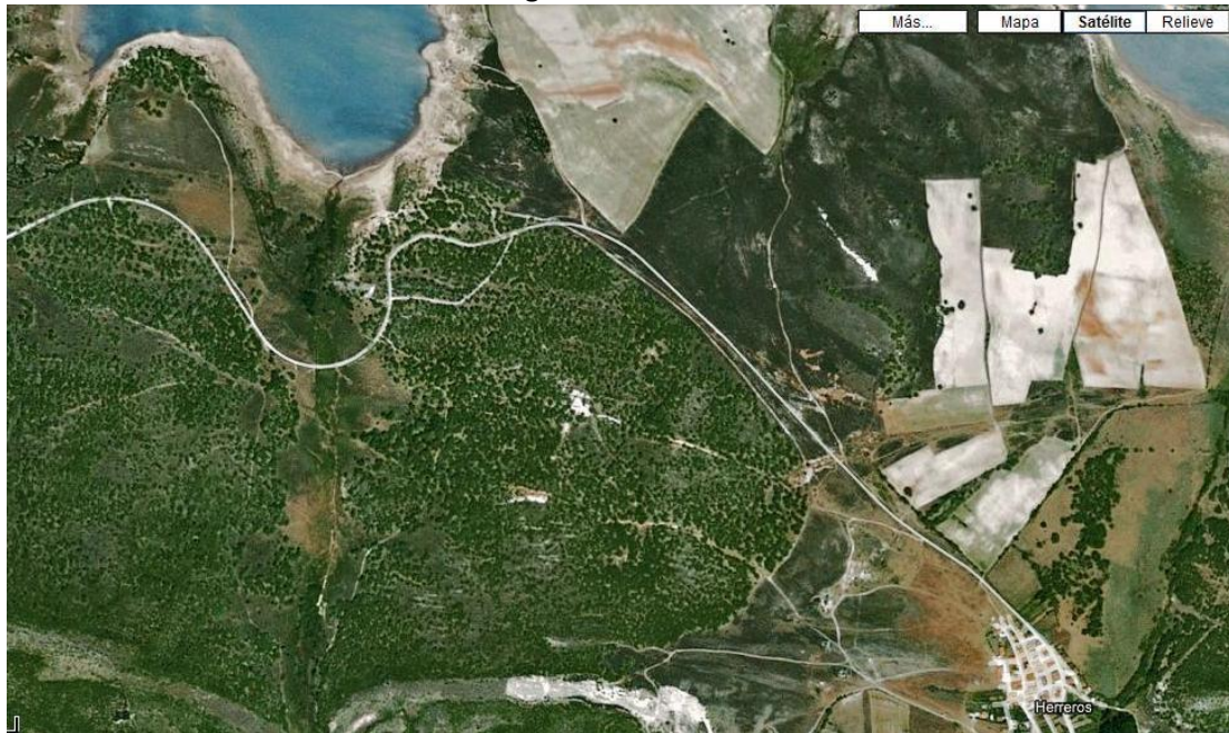
Imagen 2: El terreno de campamento.