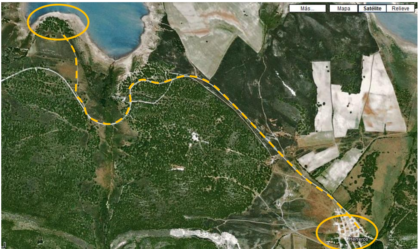
Imagen 2: El terreno del campamento

Además, el terreno cuenta con muchas explanadas y todas las zonas de sombra que queramos lo que hace que en las horas de más calor podamos estar tranquilamente haciendo las actividades.