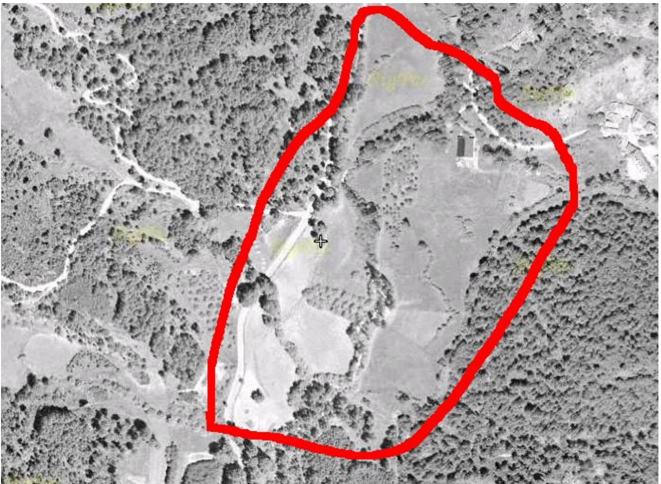
Imagen 2: El terreno de Campamento a vista de pájaro

El terreno lo compartiremos con un grupo de scouts MSC de Jerez. Es un terreno muy grande con capacidad para unas 150 personas. Contamos con un pequeño techado (en la portada del dossier) que puede hacer las funciones de comedor.